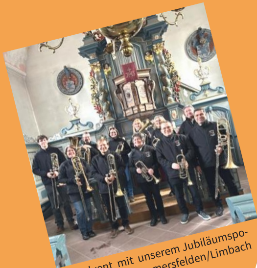
1. Advent mit unserem Jubiläumspo- saunenchor Pommersfelden/Limbach