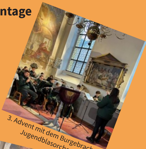
3. Advent mit dem Burgebracher Jugendblasorchester