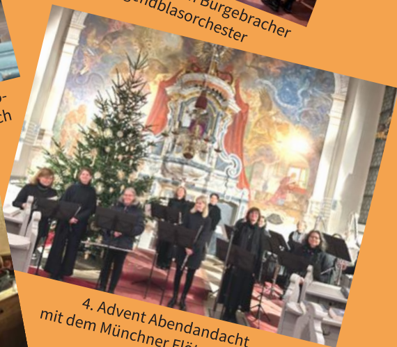
4. Advent Abendandacht mit dem Münchner Flötenensemble