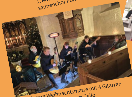
Unsere Weihnachtsmette mit 4 Gitarren und einem Cello